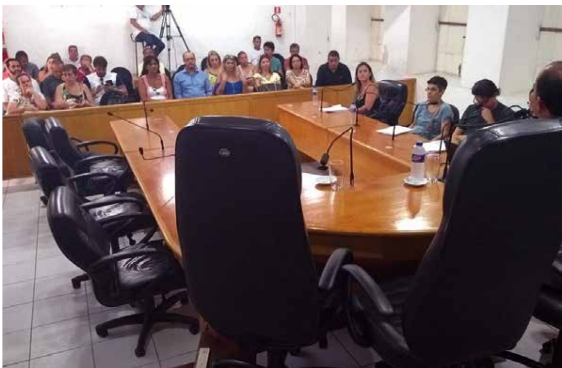
Reunião com servidores da Câmara Municipal no dia 30 de janeiro