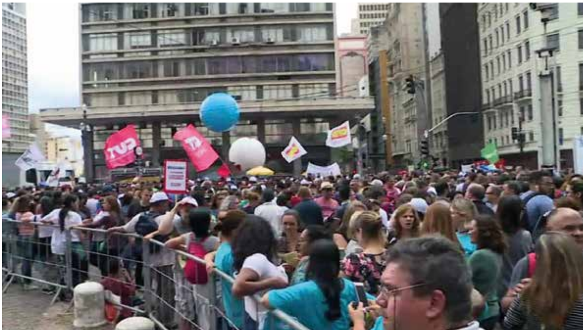
Funcionários públicos municipais em assembleia no Viaduto do Chá

Algumas escolas não abriram. Na Escola Municipal Doutor Miguel Vieira Ferreira, em Cidade Dutra, na Zona Sul da capital, não houve o movimento típico de volta às aulas. Na porta, os pais encontraram um cartaz escrito a mão informando que a unidade está em greve.